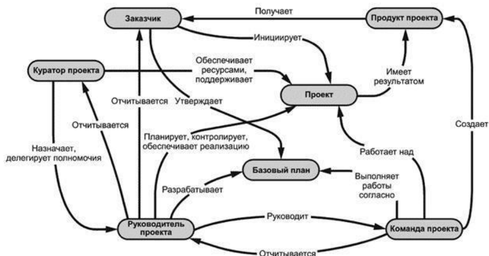
Рисунок 1 - Основные понятия проектного менеджмента и их взаимосвязь